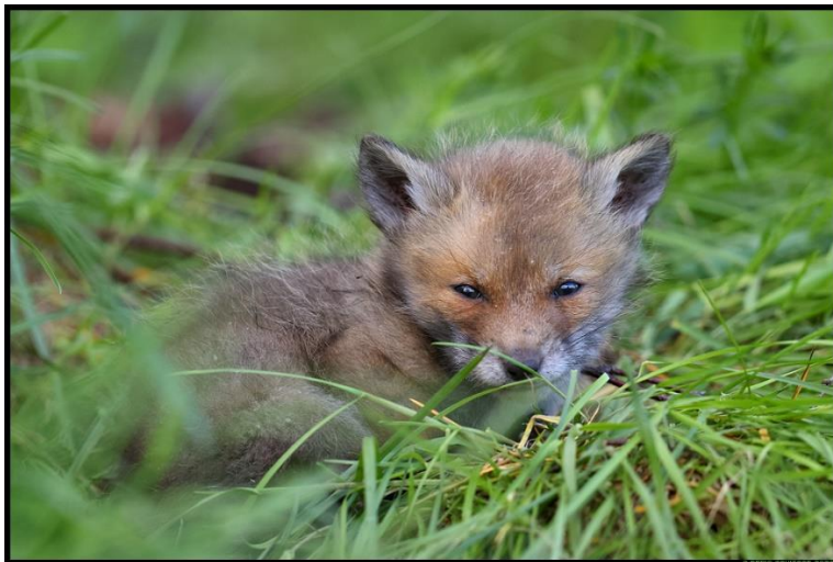
Joonis 2. Rebasebeebi, Baby fox. (Savisaar, 2020)

Diagrammid tehakse tasapinnalised. Diagrammidel olev tekst ja arvud vormindatakse Times New Roman kirjas suurusega 11 või 12 punkti, aga kõigil diagrammidel ühtemoodi. Diagrammi telgedele, millel on arvandmed, tuleb lisada telje nimed, välja arvatud juhul, kui teljel on kuupäevad või aastad ning sellest arusaamiseks vajalik info on joonise allkirjas. (vt Joonis 3)