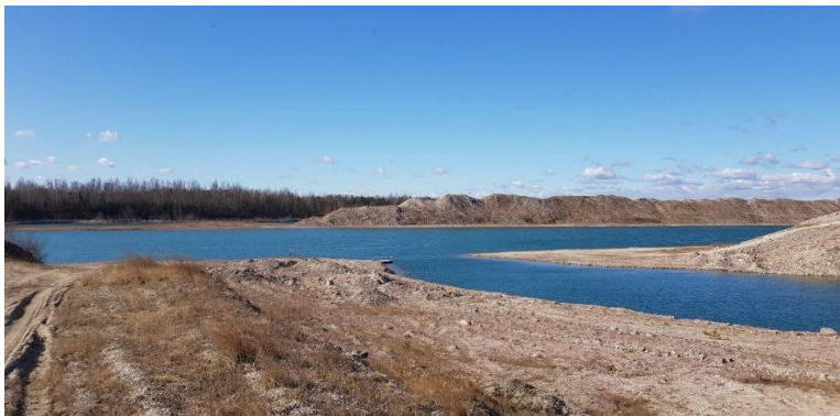
Joonis 1. Aidu karjäär. Raili Rooba, 2020, erakogu

Muudest allikatest pärineva joonise allkirja järel pannakse punkt, sulgudes tuleb viidata allikale (vt Joonis 2).